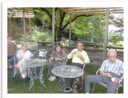
【アイスを食べに安富牧場へ】