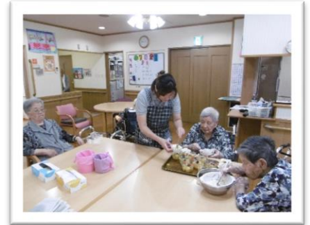
【みんなで食事の盛付け】