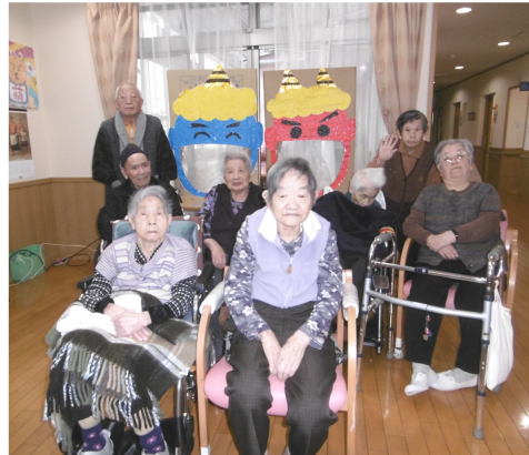
大きな鬼の口目掛けて豆を投げ入れています。「やったー！」と声が聞こえてきそうですね。