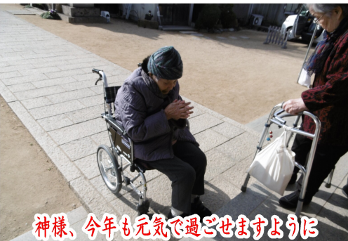
神様、今年も元気で過ごせますように