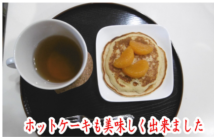
ホットケーキも美味しく出来ました