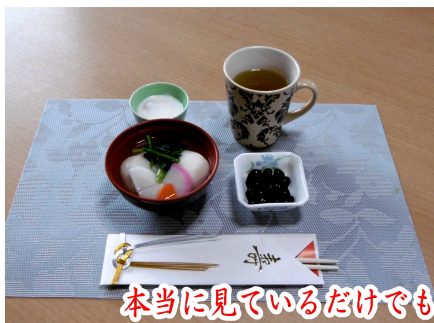
本当に見ているだけでも、かわいい和菓子や、お正月料理ですね