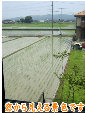
窓から見える景色です

本人様は、よく外を見られているので私たちが気付かないような細かいところまで、とても上手に描かれておられます。「私から見ても、とても上手な絵をたくさん描いて欲しいです。」 (二階)