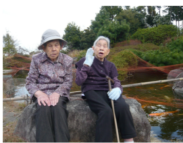
1便 ケーキ・山陽ハイツ