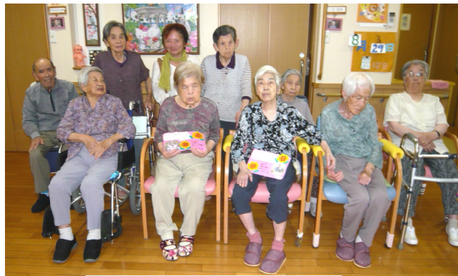
娘さんも一緒に記念撮影