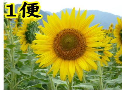
少し離れた所のひまわりは、一番きれいに咲いていたので、思わず「アップ」で激写。