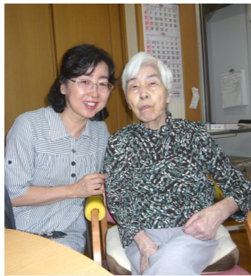
プレゼントの服を着て、ハイ、チーズ！