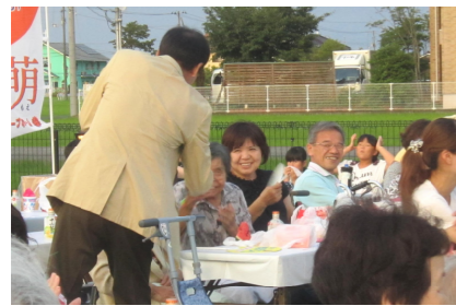
丸山さんは、さすがプロ歌手。とってもいい声で観客を魅了する歌唱で楽しませてくれました。お客様にも一人一人挨拶と握手をされていました。