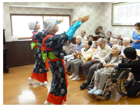
3年ぶりの「蘭」の皆様の手品、踊りと楽しませて下さいました。