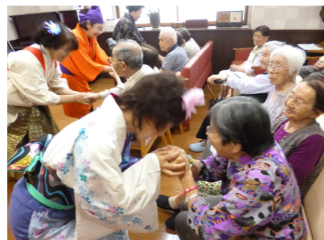
ボランティア「蘭」の皆様が、お別れの挨拶に、利用者様一人一人に握手をして下さり、声を掛けて下さいました。楽しい時間もあっという間でしたが、本当にありがとうございました。