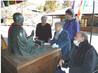
良くなりますように！